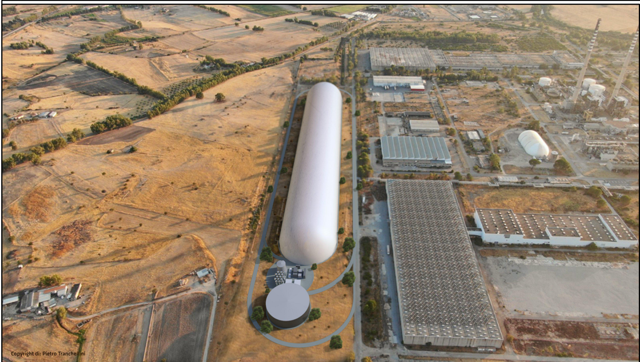
FOTO 1 - POST INTERVENTO